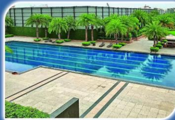
LARGE SWIMMING POOL