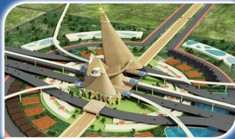
Gujarat Trade Center