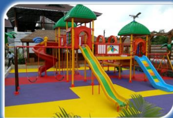
CHILDREN PLAYING AREA