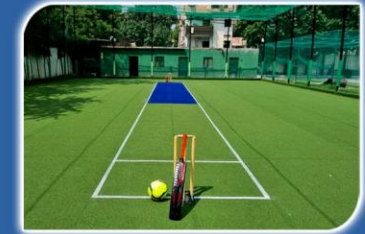
MINI CRICKET GROUNDCHIEF