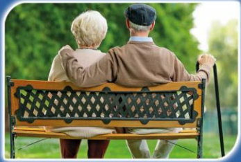
SENIOR CITIZEN PARK