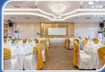
CONFERENCE/ MARIAGE HALL