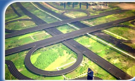
250 Mtr Expressway Road